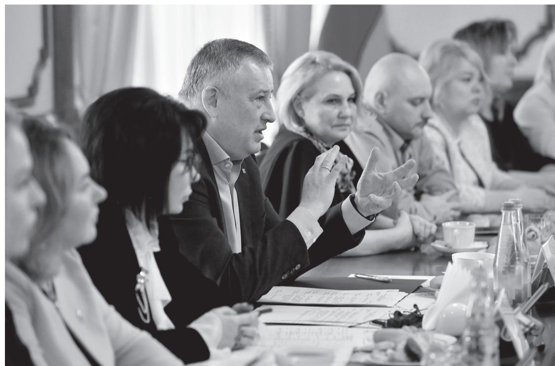
Руководство Ленинградской области на встрече с жёнами участников СВО

В ЛЕНИНГРАДСКОЙ ОБЛАСТИ ДЕЙСТВУЕТ 49 МЕР СОЦИАЛЬНОЙ ПОДДЕРЖКИ УЧАСТНИКОВ СВО И ИХ СЕМЕЙ