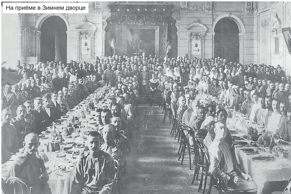
На приёме в Зимнем дворце

всем многая лета и новых побед над врагами во славу Отечества. На выходе из Зимнего дворца, нам всем вручают наши сертификаты, из которых мы обедали. Память на всю жизнь.