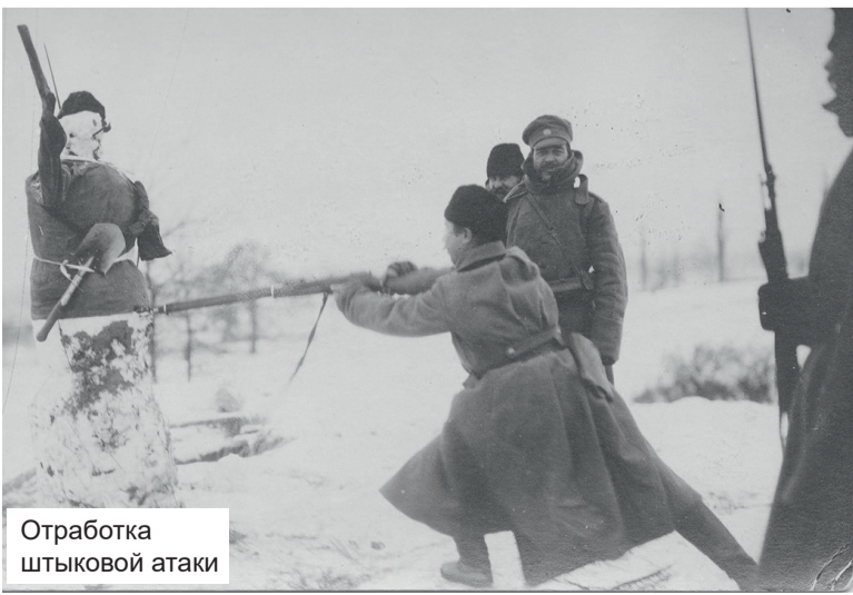
Отработка штыковой атаки