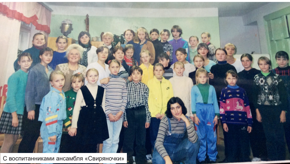
С воспитанниками ансамбля «Свирияночки»

Константин КАШИН