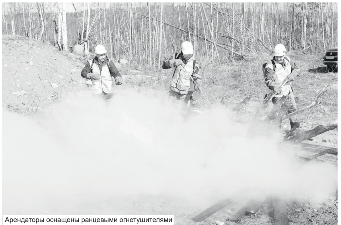
Арендаторы оснащены ранцевыми огнетушителями