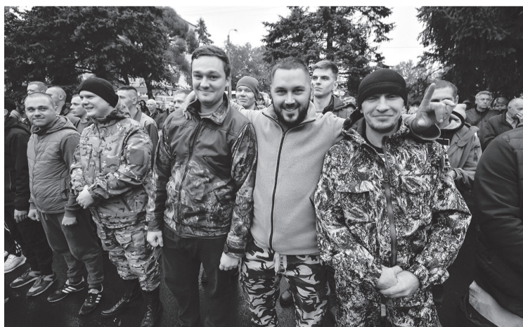
Меры поддержки доступны с момента поступления на службу