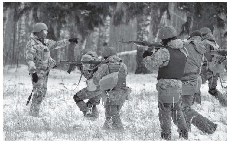
В Лужском районе бойцы проходят боевое слаживание перед отправкой на фронт