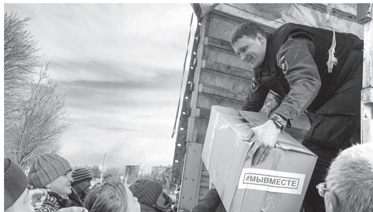
Волонтеры активно собирают помощь для наших защитников

Ещё одной востребованной мерой поддержки для семей мобилизованных стала губер-