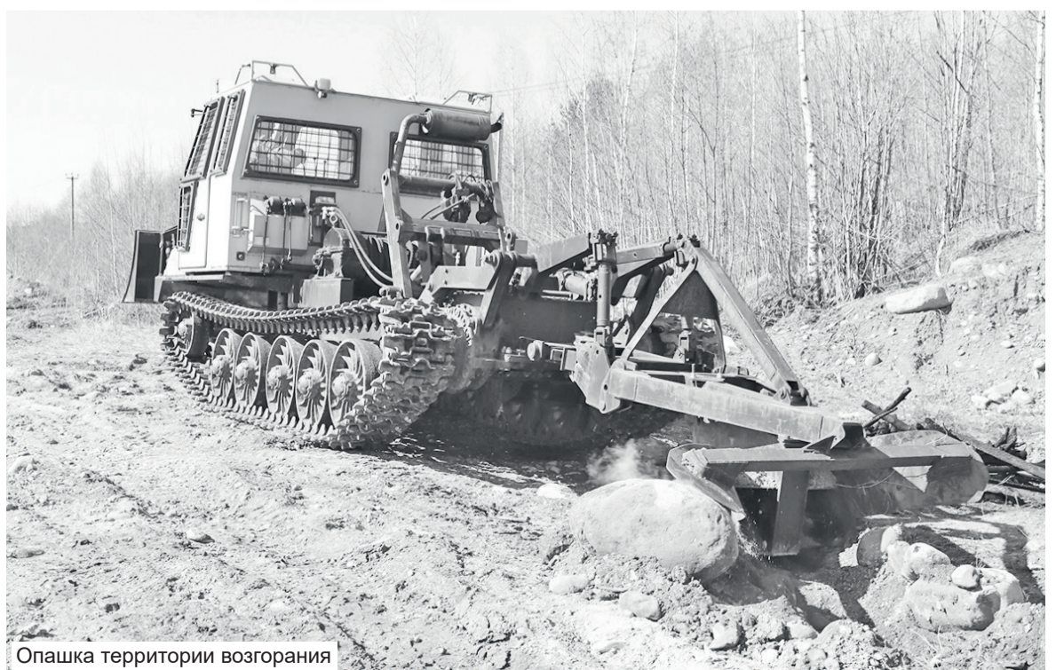
Опашка территории возгорания