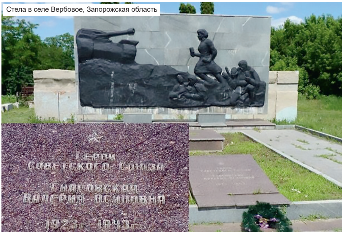
Стела в селе Вербовое, Запорожская область