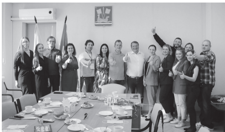
Штабы движения работают во всех районах Ленобласти