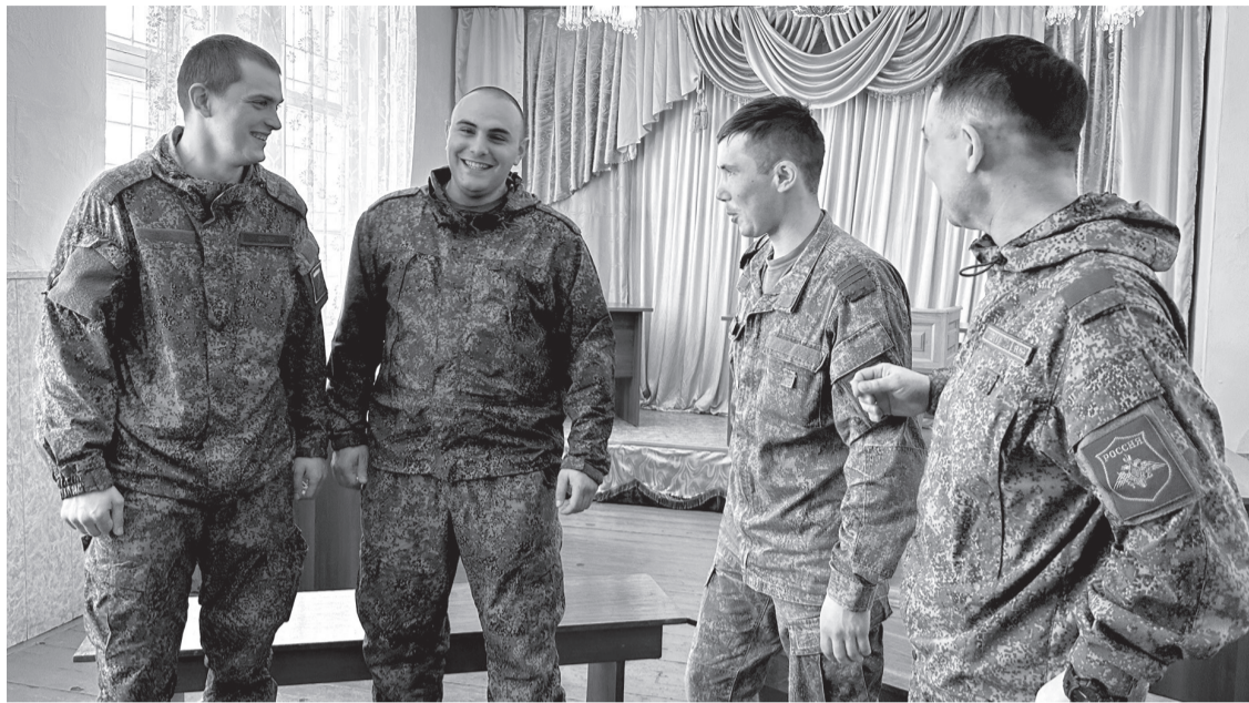
Дух боевого братства ветераны СВО сохранили и по возвращении с фронта

Бобёр любит повторять: «На передовой не страшно толь-